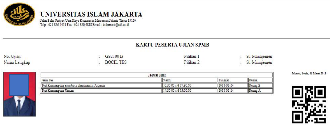
Gambar 6 Cetak Kartu Peserta Ujian SPMB