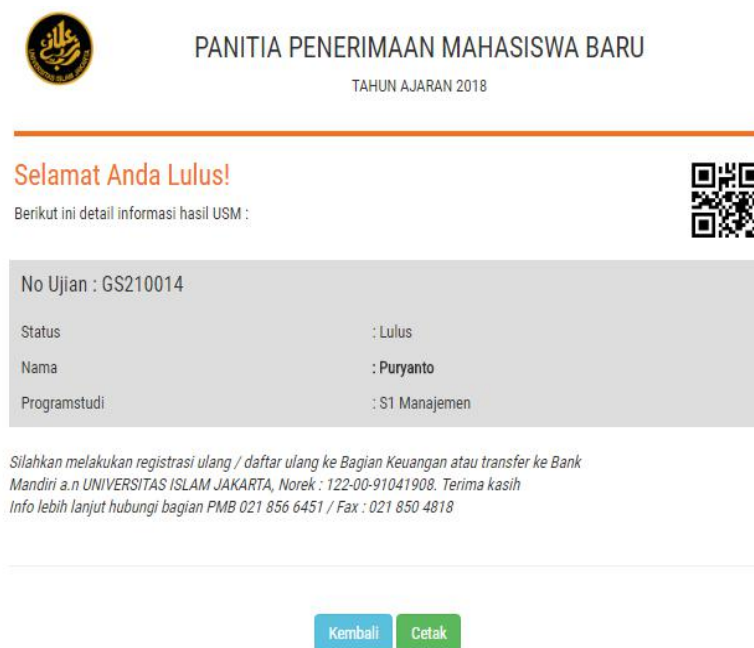
Gambar 7 Hasil Pengumuman Ujian SPMB

Setelah melaksanakan ujian, mahasiswa dapat melihat hasil ujian sesuai dengan tanggal yang telah ditentukan oleh pihak Universitas Islam Jakarta. Untuk melihat hasil ujian, calon mahasiswa dapat Login kembali ke http://pmb.uid.ac.id pada menu Cetak Hasil Ujian .