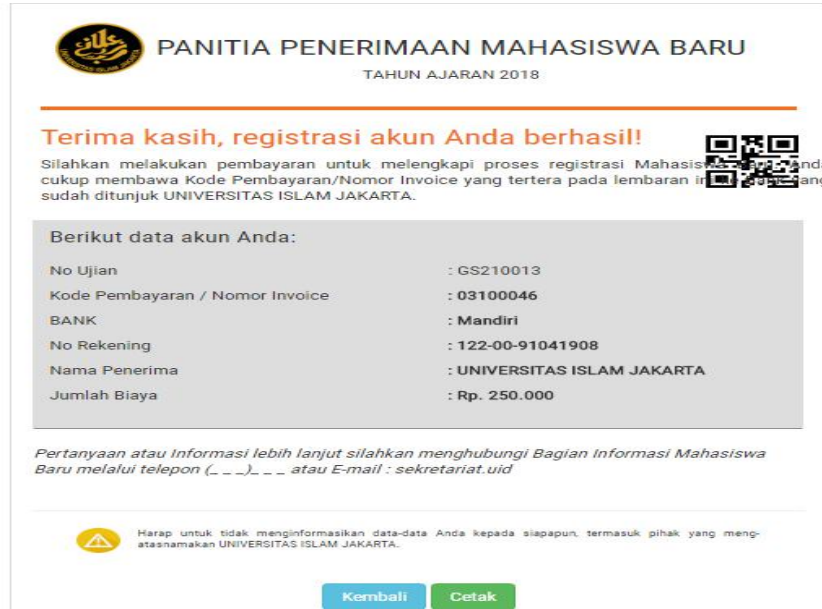
Gambar 5 Konfirmasi Bukti Pembayaran Pendaftaran telah berhasil